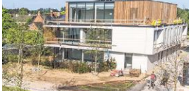
Het woonpark Ter Bourse in de Leenstraat nadert de oplevering. "Dit is het resultaat van onze visie op wonen."

Gespecialiseerde bestuurder Bouwbedrijf Romel. Diversa planta Industriële ingenieur op zak.