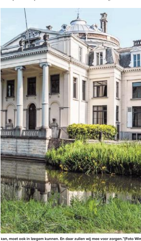
kan, moet ook in Izegem kunnen. En daar zullen wij mee voor zorgen."

Na Ter Bourse komt de site Scheldeman, met naast het kasteelpark Blauwhuis, op jullie bord. "Die is nauw verbonden met het Blauwhuis-verhaal. 2,5 hectare groot en pal naast het park... De puzzel valt perfect in elkaar. Eind